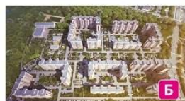
ЖК «Новое Бутово»